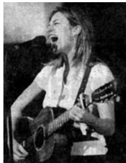
A 20h30 au parc du Jas de Bouffan. Gratuit. tél. 04 42 63 10 11